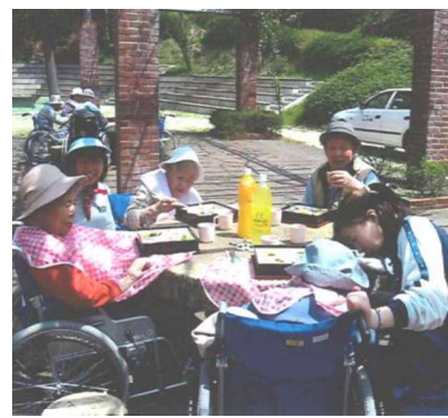
野村ダムにてお花見