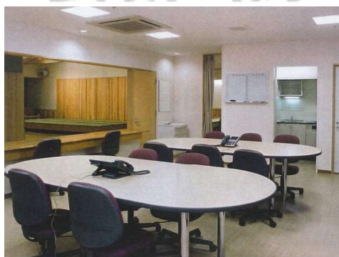
介護ステーション