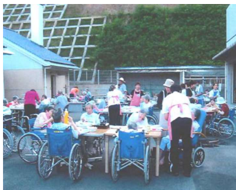
園内そうめん流し