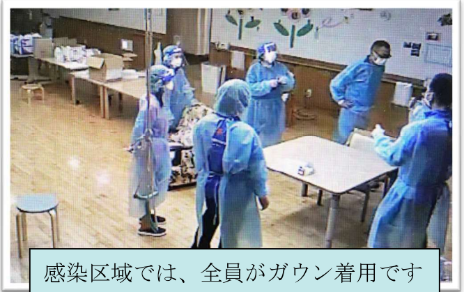
感染区域では、全員がガウン着用です