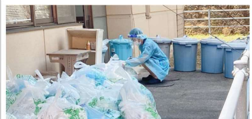
感染区域から出たゴミは、3日間保管した後に破棄します