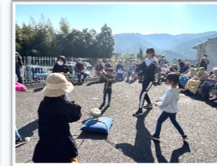
お亥の子がんばれ~