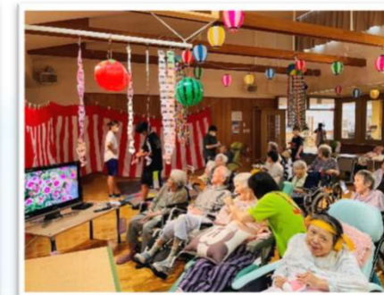
みんな揃って納涼祭