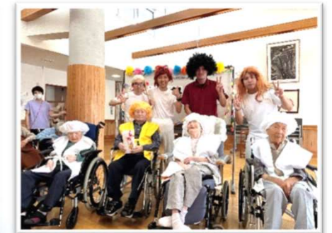
敬老の日おめでとう