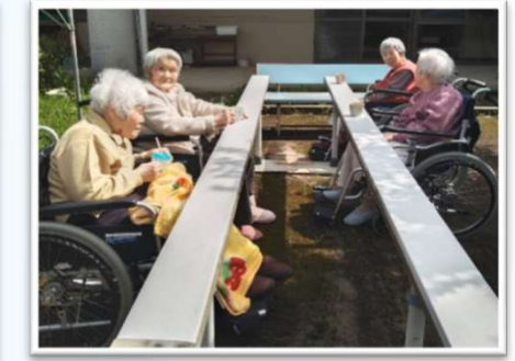
中庭でちょっと一息