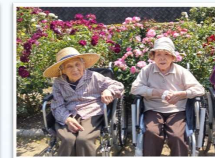
バラ園に来ました