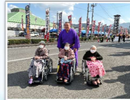
力士は大きいねえ~