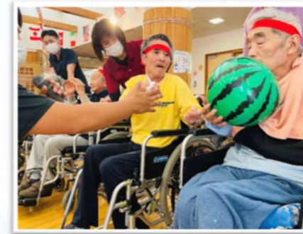
運動会のボール運びリレー

しいのき園では、季節に応じてさまざまな行事を開催しています。 そのほかにも外出や里帰り等も行い、楽しみ場の提供できるよう努めております。