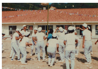
昭和56年 初めての運動会

令和5年10月13日に入札を行い、10月24日に施工業者様と契約を結び、翌25日には着工と急ピッチで進ん